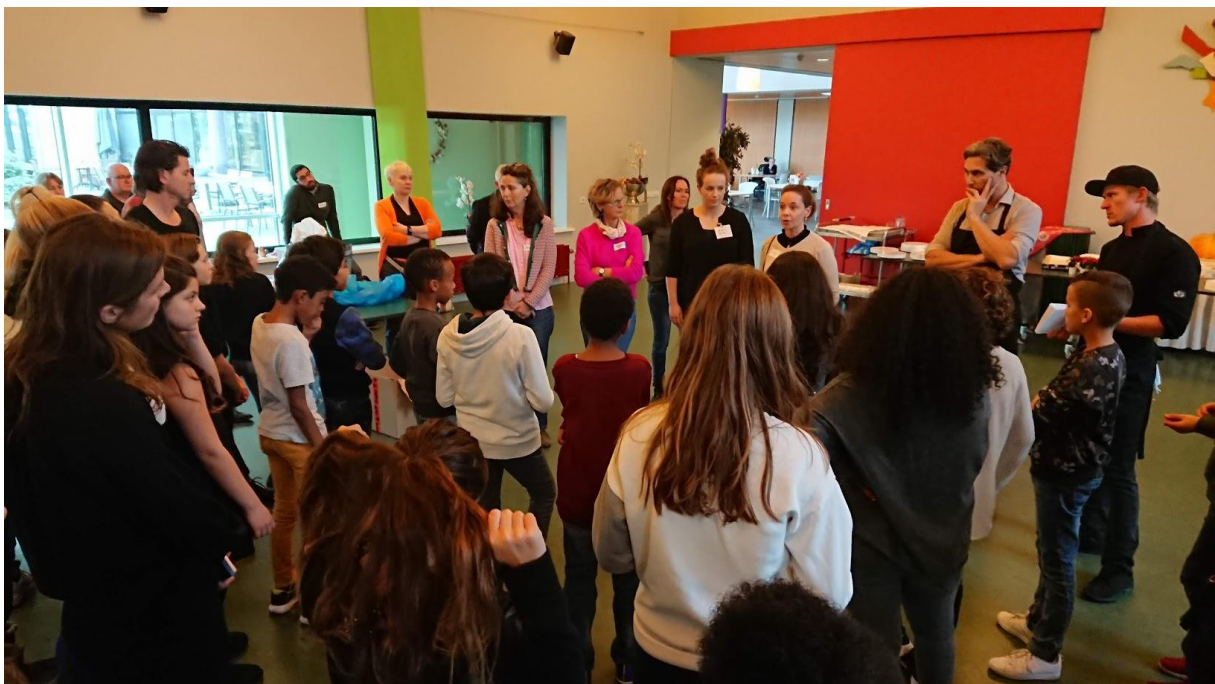
Basisschool de Ark en Vreugdehof, donderdag 14 feb. 2019, Valentijnsdag

De Johanneschool en verpleeghuis Leo Polak, donderdag 28 november 2019