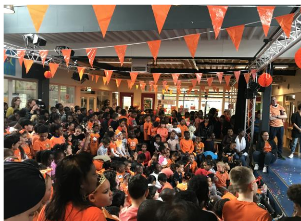
Koningsdag 2019 op de Holendrechtschool

De vrijwilligers van het ontbijtteam zijn naast het helpen bij het ontbijt ook actief betrokken geweest bij andere schoolactiviteiten zoals het Koningsdag feest, het eindejaarsfeest van groep 8, Sinterklaas, Kerst en andere events die de school voor de kinderen en ouders organiseert. Ze hebben allerlei hand-en-span - diensten geleverd. Door deze extra zaken ook op te pakken is de band met de school, de kinderen, de docenten en ook met andere ouders nog meer versterkt. Dit heeft een positieve bijdrage geleverd in zijn geheel voor de sfeer in de school.